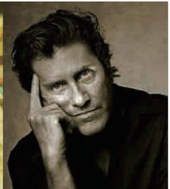
《マルセロ・フォン・シュワルツ》 映画監督、建築家、芸術写真家