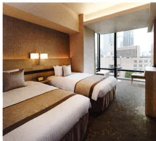
ツインルーム 客室一例