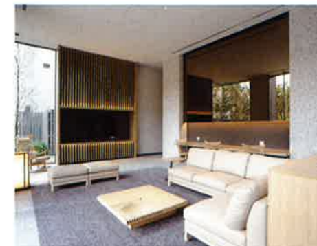
1階 ギャザリングスペース