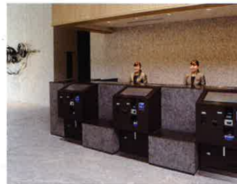
1階 フロントカウンター